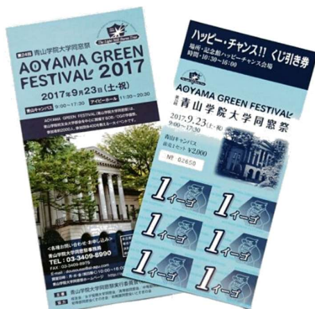
リーフレットとイーゴ券

※当日青山キャンパス内での現金は一切使用できません。 食事や買い物、各企画への参加はイーゴ券が必要です。